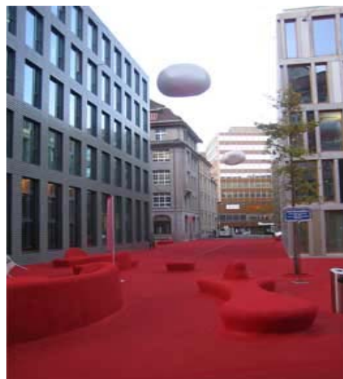
Der Rote Platz in St. Gallen